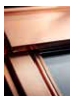
do okien w obróbce miedzianej – prosimy o kontakt z Działem Obsługi Klienta