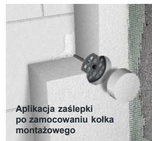
Aplikacja zaślepki po zamocowaniu kołka montażowego